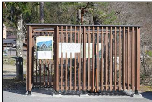
フィリップモリスが寄付した加熱式タバコ専用喫煙所

さらに、3月7日の朝刊の全面広告をみて3度目のビックリ。「燃焼しない、という価値、社会への影響」「燃焼させないアプローチが火災を減らす」を大きくアピールしています。